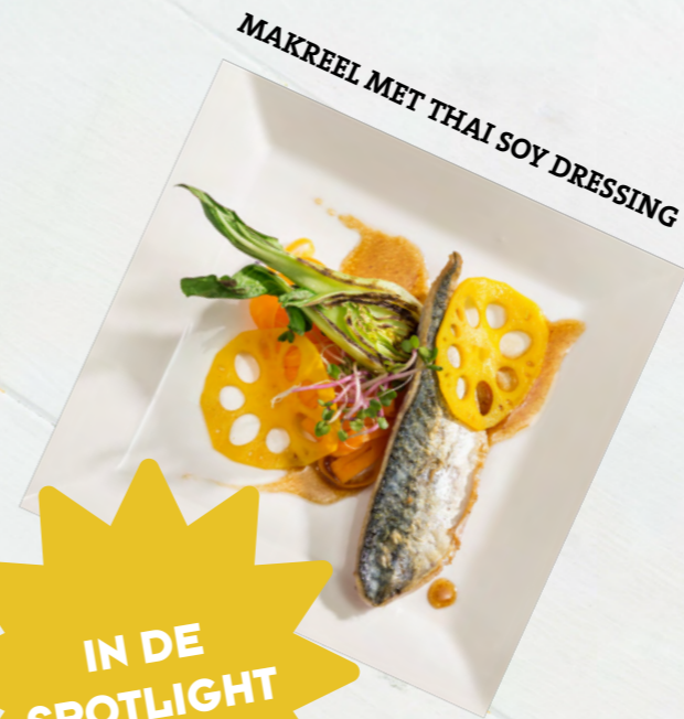
MAKREEL MET THAI SOY DRESSING