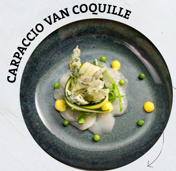
CARPACCIO VAN COQUILLE