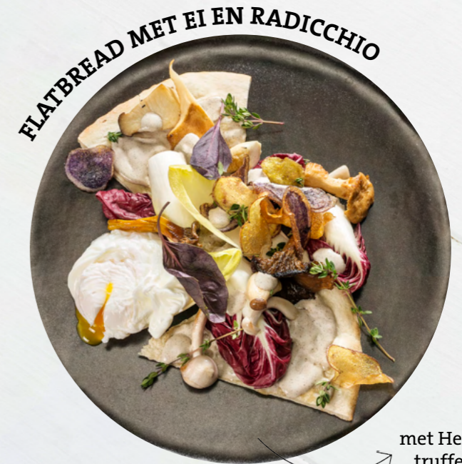
FLATBREAD MET EI EN RADICCHIO