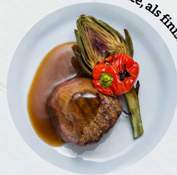
Demi glace, als finishing touch